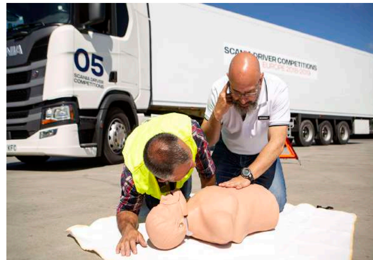
Formación Conductor Profesional