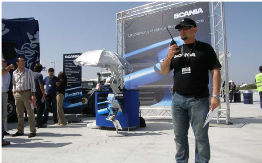
YETD Scania 2014

Porque el conductor es el complemento fundamental de la imagen que usted busca para su empresa. El mejor vehículo, una gran campaña de marketing... todo queda en manos de las habilidades sociales del último eslabón: el conductor. Nuestro fuerte.