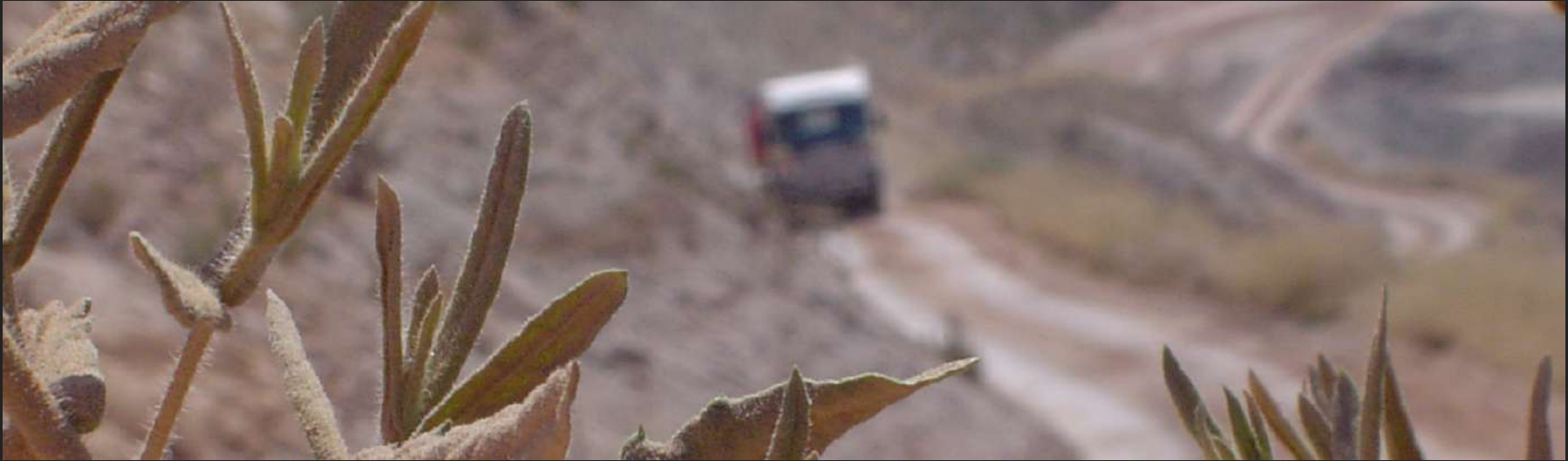
Hermanos Calzada, Mallorca