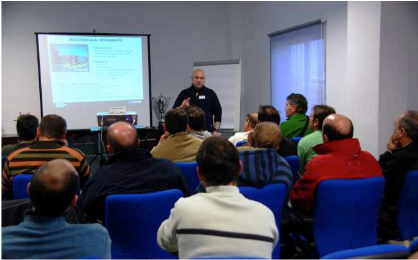
Programaciones a medida