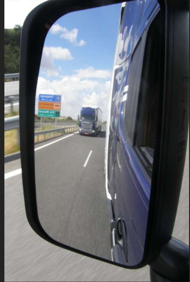
La mirada del transporte