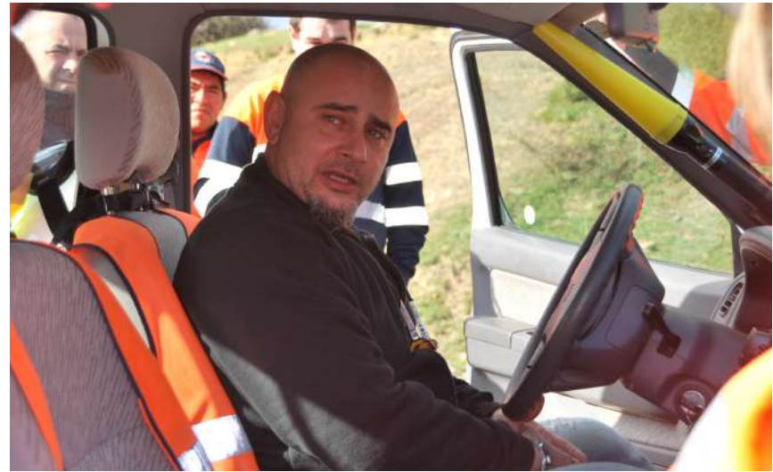
Pilotaje de seguridad