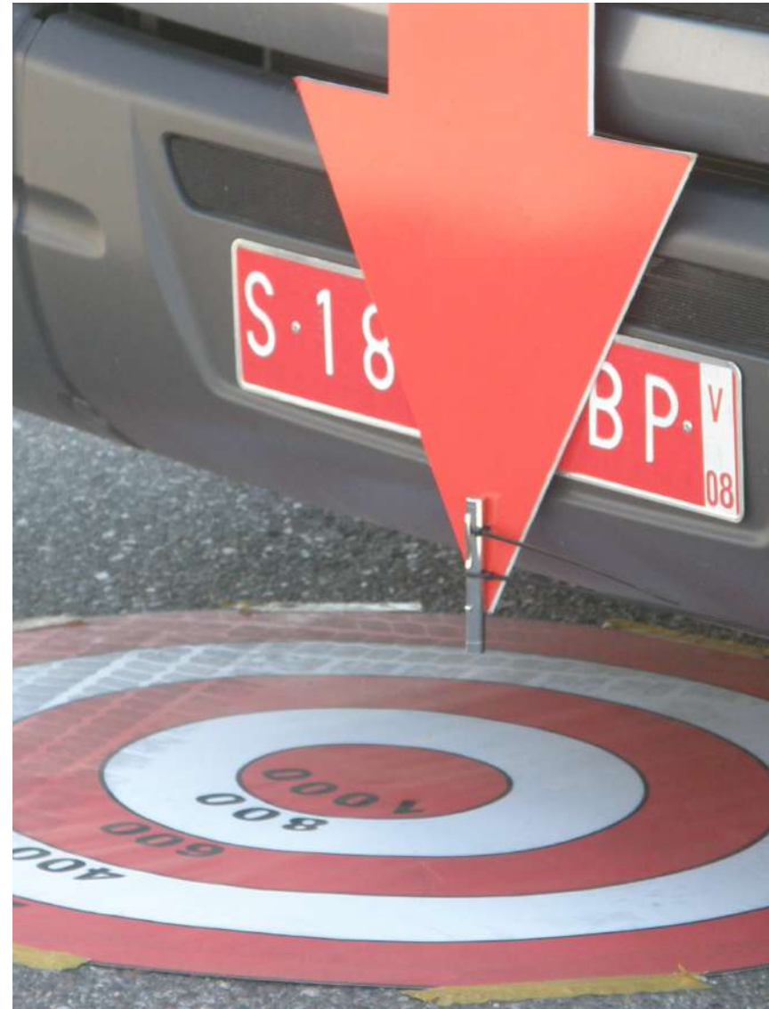
Definición del objetivo