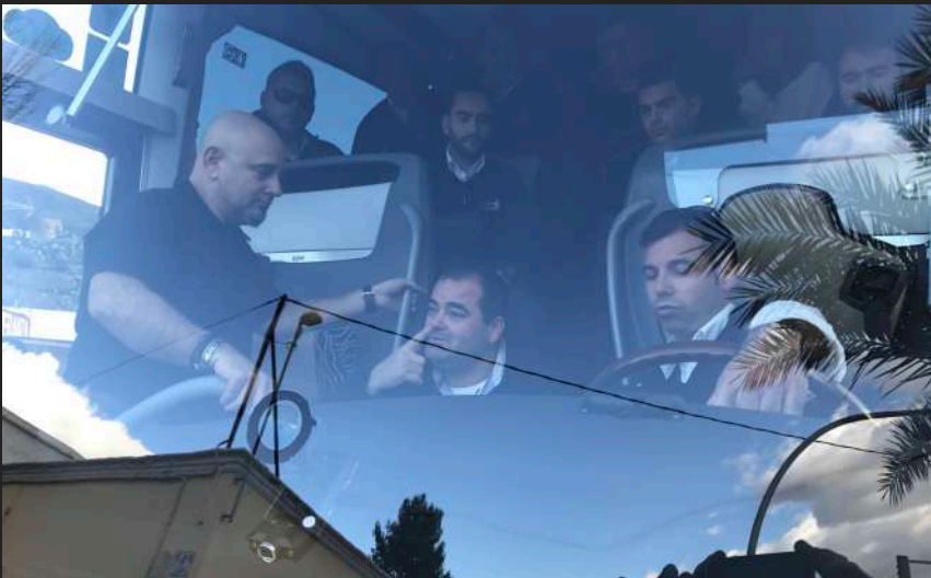
Conductores Ultramar Exprés