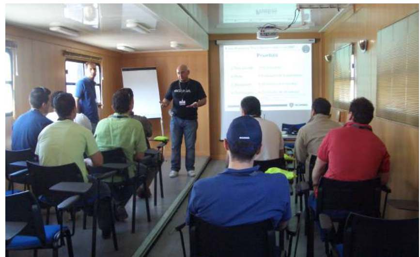
Formación In House