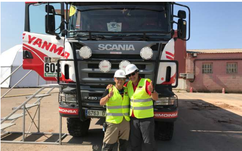
De la Patrulla Águila al Dakar